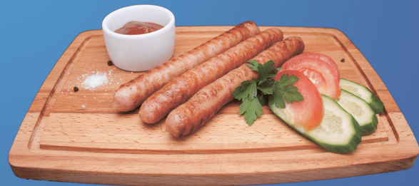
Колбаски на гриле

Подаются со свежими овощами и кетчупом 200 гр.